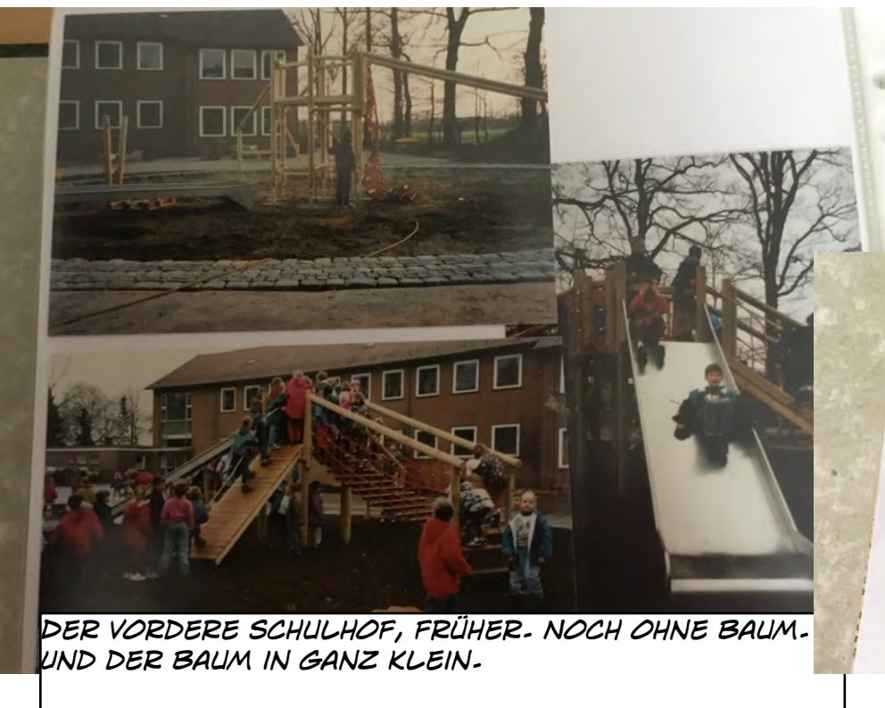
DER VORDERE SCHULHOF, FRÜHER. NOCH OHNE BAUM- UND DER BAUM IN GANZ KLEIN.